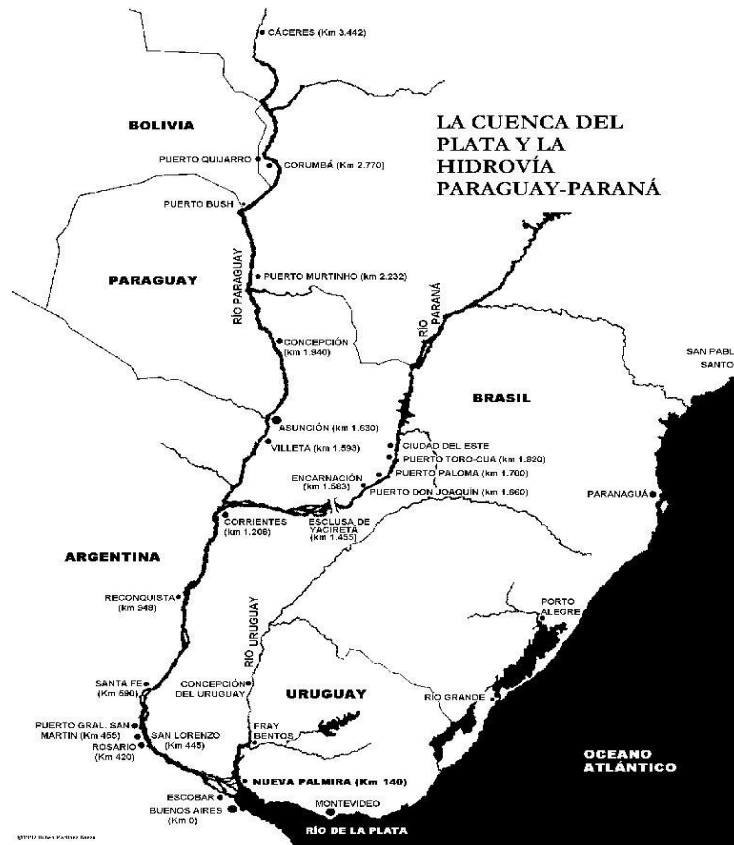
1. ábra: a La Plata medence és a Paraná- Paraguay-alföld vízhálózata