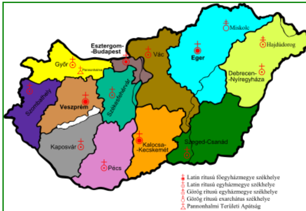
2. sz. ábra: Katolikus egyházkerületek Magyarországon

Az egyház fő feladatai közé tartozik a kezelésében lévő egészségügyi-, szociális- és oktatási intézmények fenntartása. Ezen túl, működteti a Katolikus Karitást, mely szervezet családsegítő és gyermekjóléti szolgálatot, házi szakápoló szolgálatot, szenvedélybeteg segítő szolgálatot, és idősothonokat tart fenn, és tevékeny részt vállalt például a 2010. évi borsodi árvíz kárfelszámolási feladataiban is. Részt vettek azon ingatlanok helyreállításában, amelyek károsodtak. Építészeik révén részt vettek a kárfelmérésben, az építőipari tevékenységben, az ingó dolgok beszerzésében.