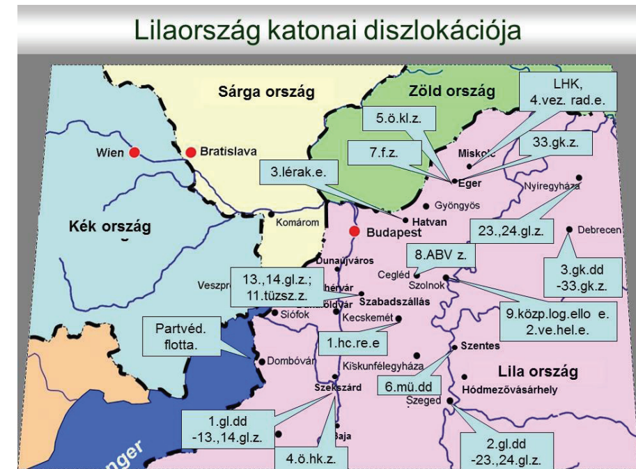
2. ábra: Lilaország haderejének helyzete

A Lila Haderő alakulatai szerződéses állománnyal 60–70%-ban vannak feltöltve. Létszámából mintegy 800–1000 fő NATO misszióban teljesít szolgálatot. Tartalék állománya vezetési, őrzés-védelmi feladatok végrehajtására alkalmas. Behívásuk, mozgósításuk 1-2 napot vesz igénybe. Megelőző védelmi helyzetben lehetősége van a személyi állomány kiegészítésére a hadkötelezettség útján. Ehhez a szükséges tervekkel, nyilvántartásokkal és végrehajtó apparátussal rendelkeznek. A hadkötelezettek hadrafoghatósága (szelektív behívás esetén) 1–1,5 hónap.